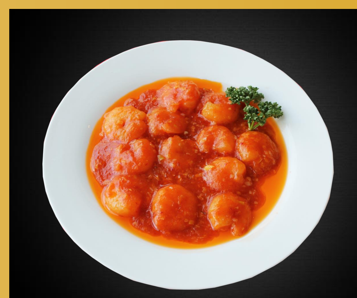
海老のチリソース