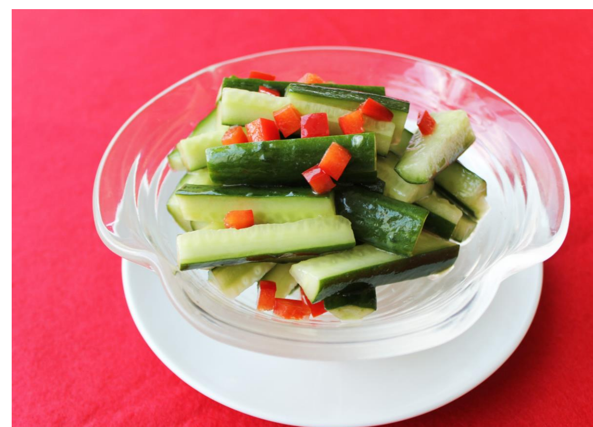
中華風胡瓜サラダ 400円